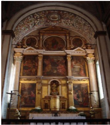
de Santa Maria

de typische witte huizen met blauw en geel omlijst