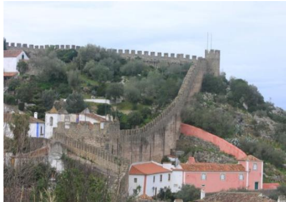
het hoofdaltaar (João da Costa) en de vestingmuur.